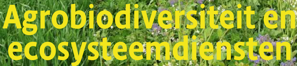
Foto 1. Een agrorand in de Hoeksche Waard bestaande uit een mengsel van visueel aantrekkelijke bloemen om de kwaliteit van het landschap te versterken. De rand stimuleert tevens natuurlijke vijanden die luizenpopulaties in de tarwe onderdrukken.